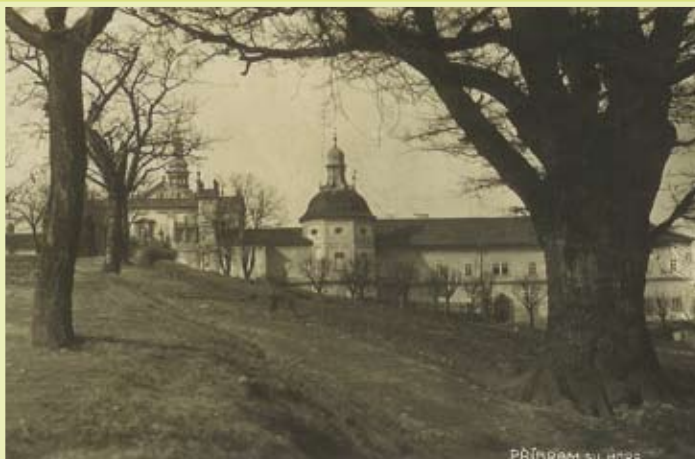
pohlednice z třicátých let minulého století

Dub byl odjakživa symbolem síly a odolnosti a jako takový získal výsadní postavení ve všech významných evropských kulturách. Považovali si jej Slované i Germáni, Keltové, Řekové i Římané. Prastaré duby jsou také symbolem stálosti a dlouhověkosti, proto se pod nimi odpradávná dávaly sliby a uzavíraly smlouvy. Od poslední doby ledové (tzn. 7000 let) jsou duby letní neodmyslitelnou součástí evropské krajiny.